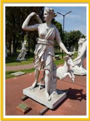
Diana, la Artemis romana